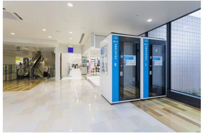
オフィスビル・商業施設内のテレキューブイメージ