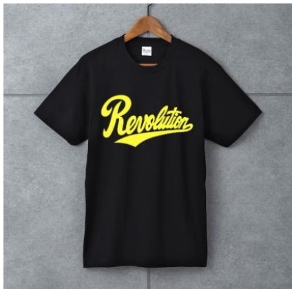
Revolution Tシャツ(ブラック) ¥4,400(税込)