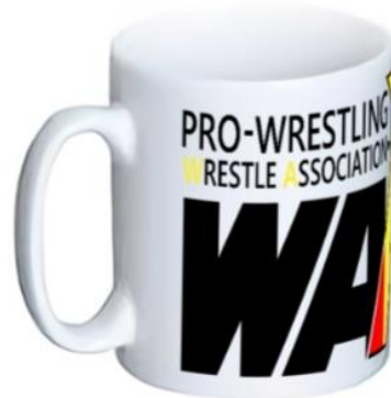
WAR 新ロゴマグカップ ¥2,500(税込)