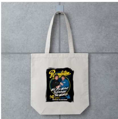
龍原砲トートバッグ ¥3,200(税込)