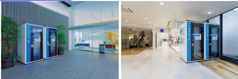
商業施設等のテレキューブ設置イメージ