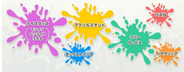
2023 年 9 月時点の「Groobee」製作サイトの販売商品より一部抜粋